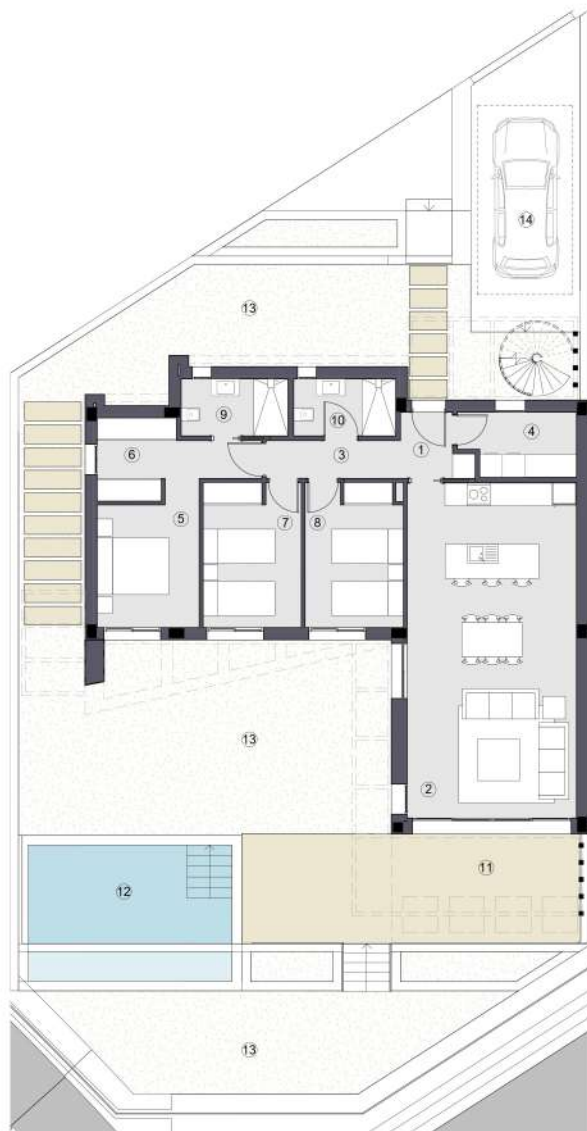
PLANTA BAJA / GROUND FLOOR